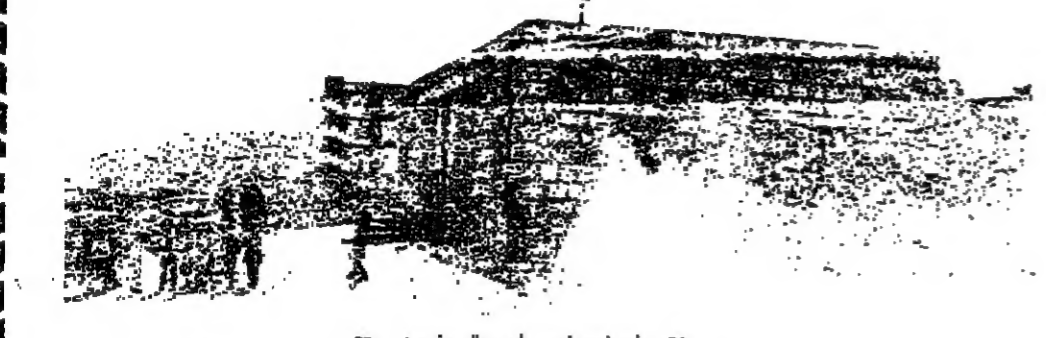
الطلاب محشورون حشرا